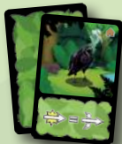
1 kraai dierkaart

Voeg deze kaarten toe aan de kaarten van het basisspel.